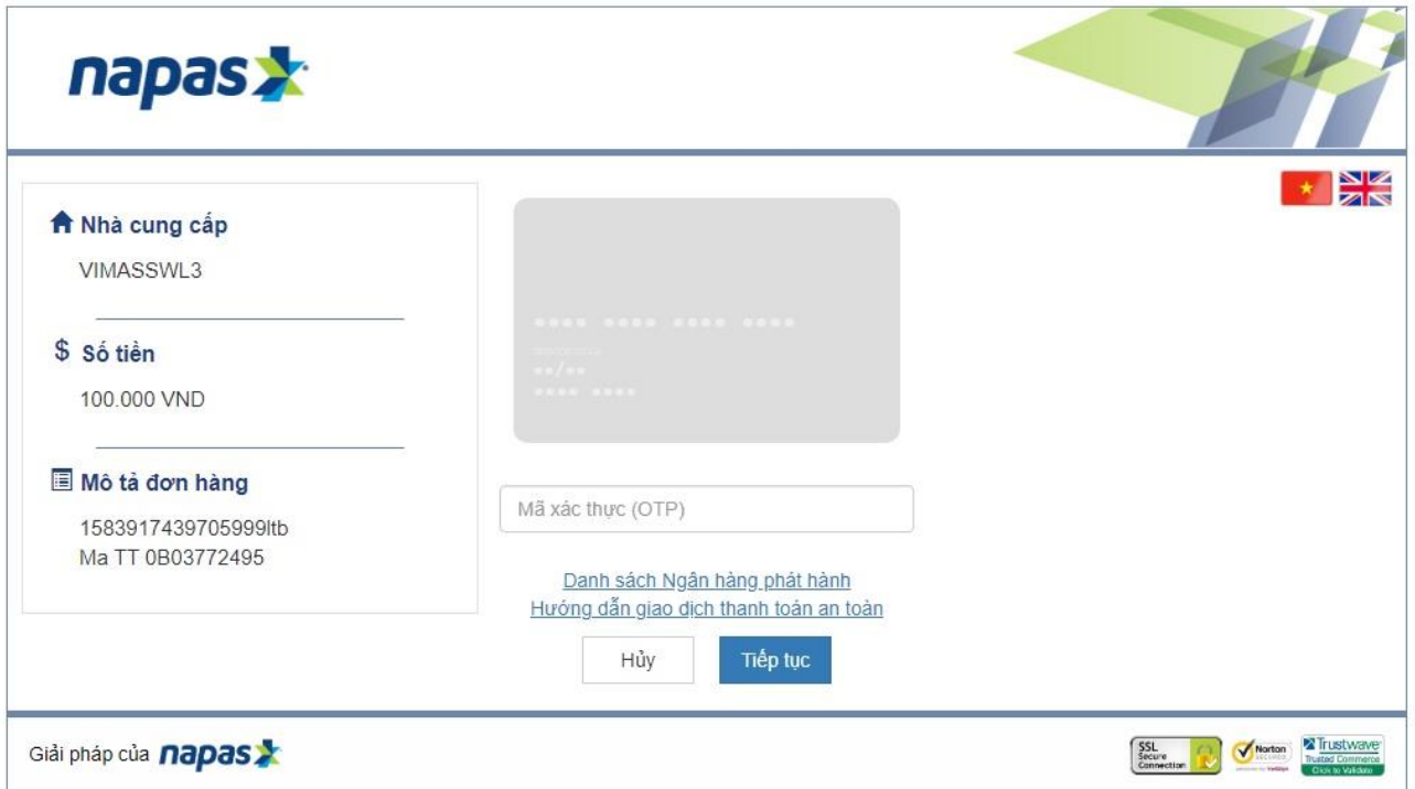
Hình 2: Giao diện nhập OTP

Giao diện có thể được bổ sung logo của KidsOnline nếu KidsOnline có yêu cầu.