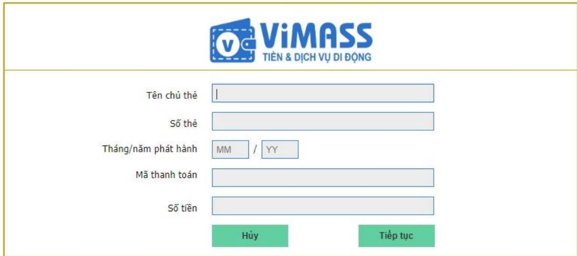
Hình 1: Giao diện nhập dữ liệu thẻ trên website

Giao diện có thể được bổ sung logo của KidsOnline nếu KidsOnline có yêu cầu.